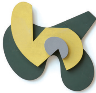
Entre balance et lunettes Hans Arp | 1954 Arp Museum Bahnhof Rolandseck

Besuchen Sie uns weiterhin auf unserer Ideen-Baustelle!