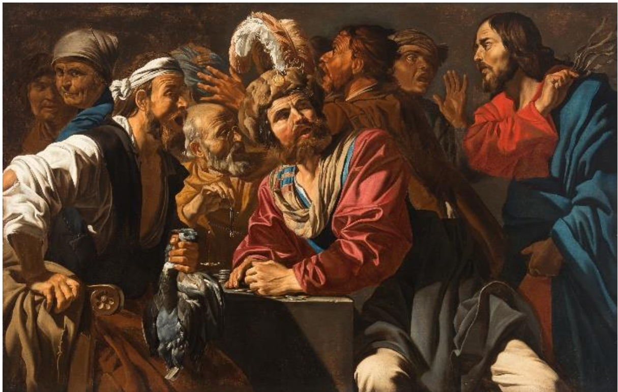
Matthias Stom | Christus vertreibt die Geldwechsler aus dem Tempel / Christ chasing the moneychangers from the Temple | ca. 1629–32