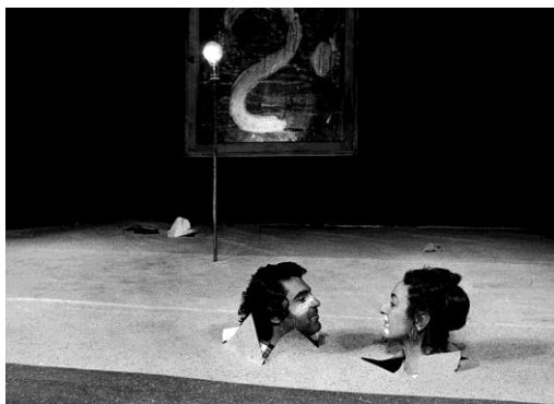
Szenenfoto der Inszenierung „Das Gasherz“ von Tristan Tzara, Düsseldorfer Schauspielhaus, Bühnenbild und Regie: Daniel Spoerri, 1972