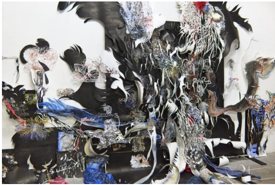
Nadja Schöllhammer, Guru (Detail aus Installation), 2014, © und Foto: Nadja Schöllhammer