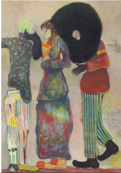
Ryan Mosley, If the sky could talk, 2015, Coleccion SOLO, Madrid, Spain