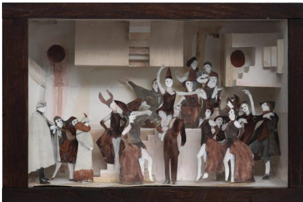
Marcel Dzama, MD/Dio 18, Let mischance be a slave to patience, 2010, Sammlung Schnetkamp, © Marcel Dzama, Sies + Höke, Düsseldorf